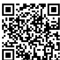
沈阳市中医院 出院服务